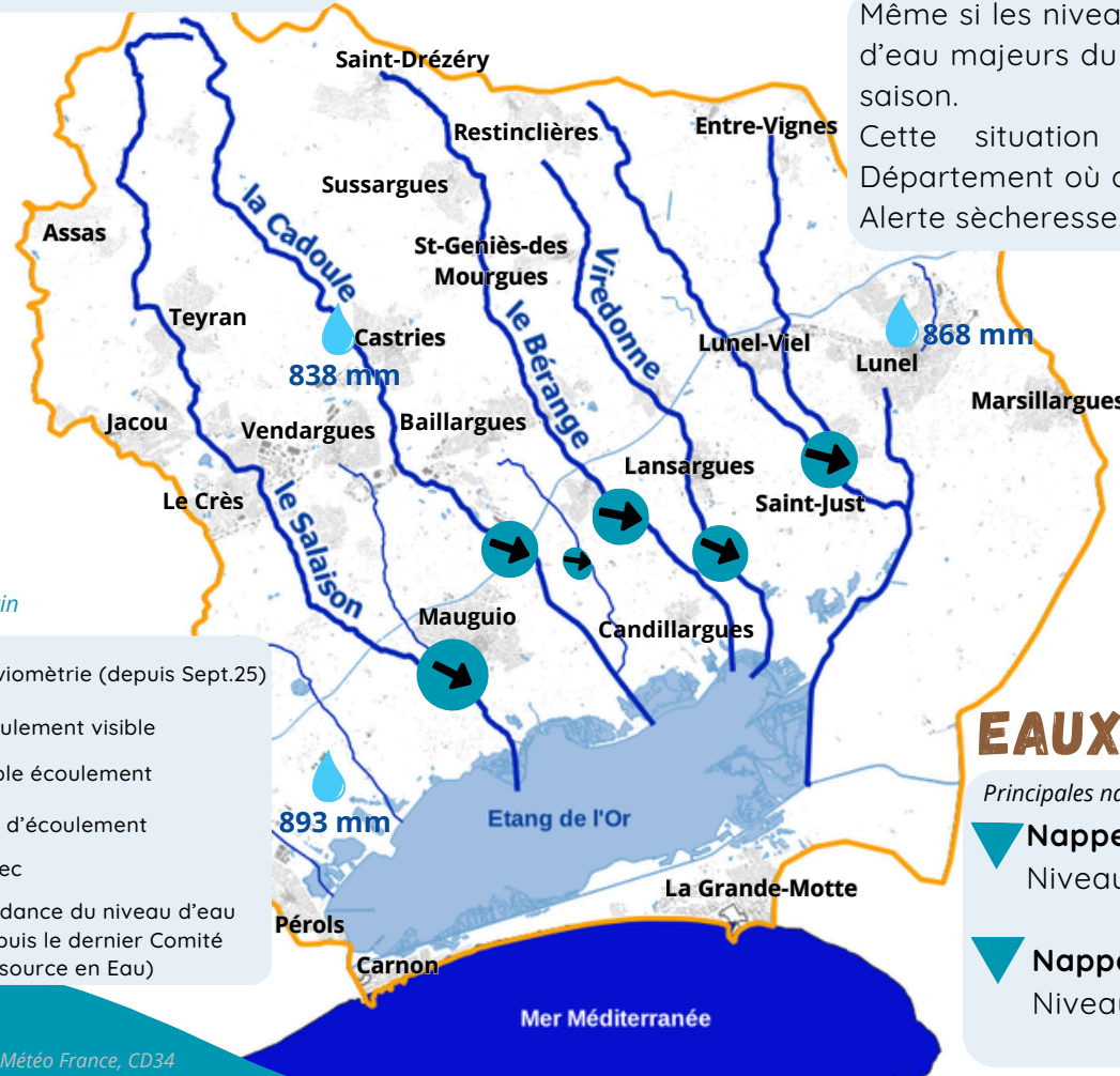
Photos et mesures des niveaux d'eau extraits du suivi terrain réalisé par le Sympo pour élaborer ce bulletin