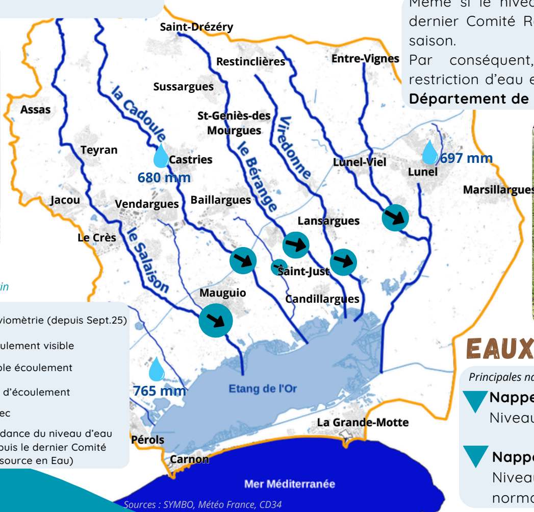
Photos et mesures des niveaux d'eau extraits du suivi terrain réalisé par le Sympo pour élaborer ce bulletin