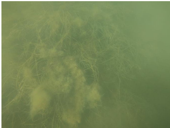
Station Carnon : Fond observé, herbier de Zostera noltii et tapis d'algues

Les méduses Aurelia aurita et autres corps gélatineux Mnemiopsis leidyi , proche parent des méduses, sont bien présents mais en concentration plus faible que le mois dernier.