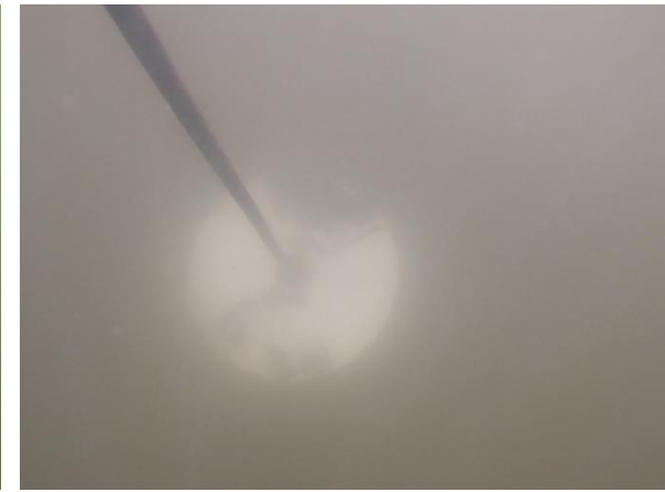
Station Bastit : mesure de la visibilité (ici le disque n'est plus visible à -50 cm)

❖ Le pH est déterminé par l'équilibre de l'ensemble des acides et des bases dissous dans l'eau. Il dépend de l'activité biologique.