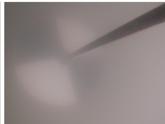
Station Centre : Mesure de la visibilité (40cm),

❖ Le pH est déterminé par l'équilibre de l'ensemble des acides et des bases dissous dans l'eau. Il dépend de l'activité biologique.