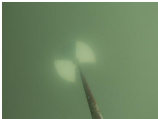
Station Carnon : Mesure de la visibilité (100cm),

Pas de corps gélatineux exotiques de petites taille du type Mnemiopsis Leydyi observées dans la colonne d'eau.