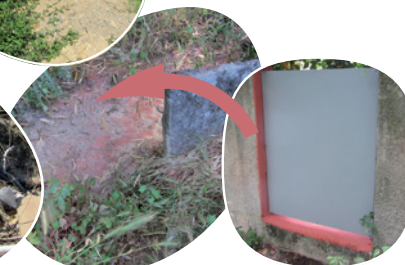
Résidu de peinture rejeté dans le ruisseau riverain

Traiter par des produits phytosanitaires à proximité directe du cours d'eau , c'est :