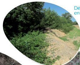
Dépôt de remblais en bord de cours d'eau

Le dépôt de remblais (gravats, produits de démolition, déchets divers) en zone inondable , quelque soit sa vocation (simple dépôt, confortement de digue, consolidation de berges) sans autorisation est passible de sanctions pénales .