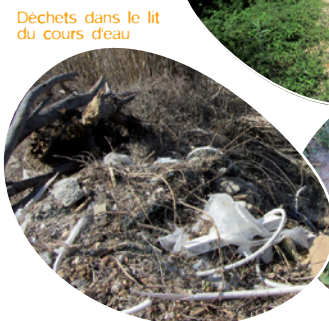
Déchets dans le lit du cours d'eau